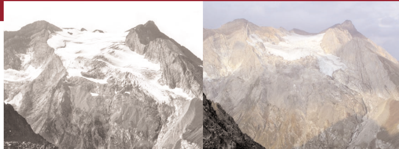
■ Le glacier d'Ossoue, dans le Vignemale, depuis le col des Gentianes: photographié par L. Gaurier le 19 septembre 1911 (à gauche), puis par P. René le 25 septembre 2005 (à droite).

Entre 1900 et 1931, l'abbé L. Gaurier (président de la commission de glaciologie des Pyrénées entre 1910 et 1931) étudie de façon rigoureuse presque tous les glaciers des Pyrénées.